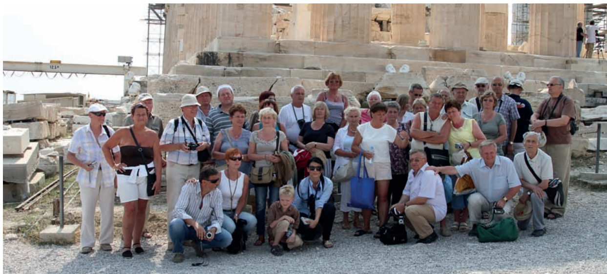
Uczestnicy wycieczki na Akropolu

Ateny ,Athina, – stolica i największe miasto Grecji. Jeden z najważniejszych ośrodków turystycznych Europy zabytkami kultury antycznej. Nominalnie Ateny to tylko centralna część metropolii, prawnie stanowiąca samodzielną gminę miejską o tej właśnie nazwie – liczy 796 tys. mieszkańców, zameldowanych tu na powierzchni 38,964 km 2 podzielonej na 7 dzielnic. Niemniej obszar metropolitalny Wielkich Aten, odpowiadający polskiemu znaczeniu słowa „miasto”, składa się z kilkunastu gmin, które zrosły się w jeden organizm miejski liczący 4,01 miliona mieszkańców (dane z roku 2004) i 411,717 km 2 . Te dane nie obejmują osób zamieszkałych, lecz niezameldowanych w Atenach, gdyż zmiana meldunku nie jest dla Greka obowiązkowa i wystarcza rejestracja obywatela w miejscowości przechowywania rejestru urodzeń. Według danych Ministerstwa Oświaty, 38% dzieci szkolnych, uczących się w gminie „Ateny”, nie posiada greckich korzeni rodzinnych. Przyjmuje się, że Ateny zamieszkuje także ponad milion cudzoziemców, przeważnie niezameldowanych. Na podstawie nowego prawa imigracyjnego, dzieci cudzoziemców, urodzone w Grecji i uczęszczające do greckich szkół, od 2010 roku będą mogły ubiegać się o greckie obywatelstwo.